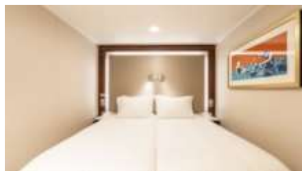
พัก 1-2 ท่าน

From 13 - 14 sq.m Max Occupancy 2-4 ^ Deck 5/8/9/10/11/12/13/15 2 Single Beds / 2 Single Beds + 1 Ceiling Pullman Bed / 1 Single Bed + 1 Pullman Bed + 1 Double Sofa Bed