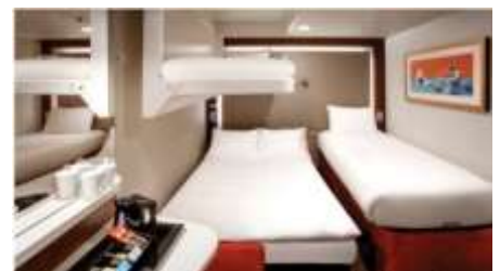
พัก 3-4 ท่าน