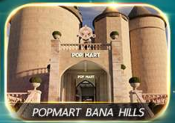
POPMART BANA HILLS

สัมพัสความงามหมู่บ้านฝรั่งเศสที่บานาฮิลล์ ซ่อมบิง POPMART