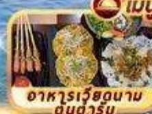
อาหารเวียดนาม ดนัง