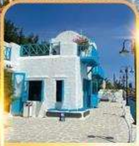
SON TRA MARINA CAFE