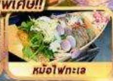
หม้อไฟทะเล