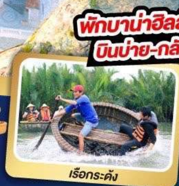
เรือกระด้ง