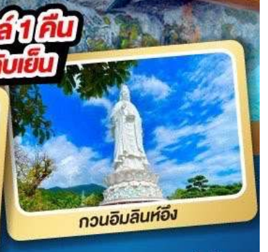
กวนอิมลินท้อ