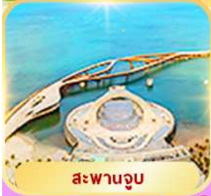
สะพานจูบ

สวนสนุก Vin Wonder + สวนน้ำ Aquatopia, Sun World Hon Thom