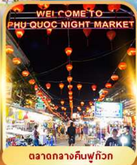
ตลาดกลางคืนฟูก๊วก