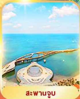
สะพานจวบ