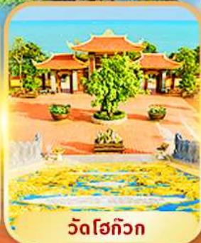
วัดโฮก๊วก