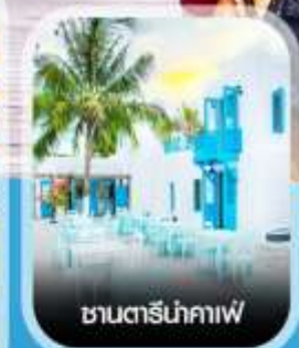
ซานตารีน่าคาเฟ่