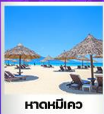
หาดหมีคว