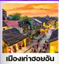
เมืองเก่าฮอยอัน