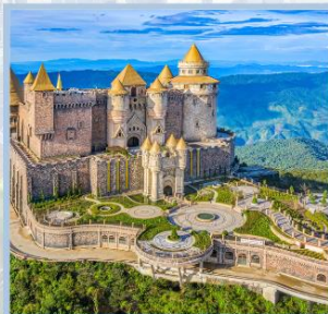
ปราสาทจันทรา