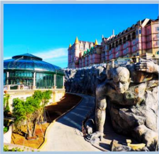
โซอู Eclipse Square