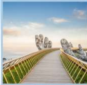
สะพานมือทองคำ