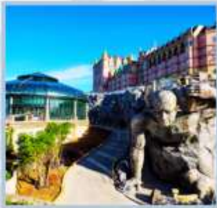
Tou Eclipse Square