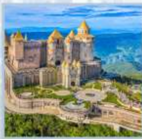
ปราสาทจันทร์