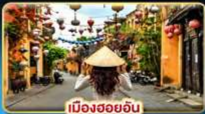
เมืองฮอยอัน