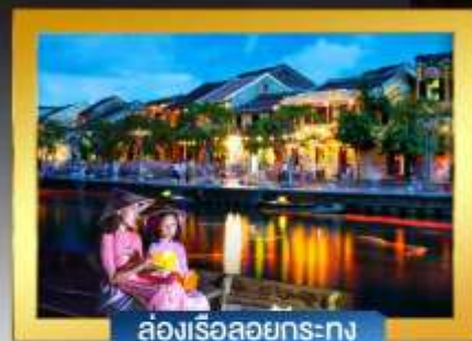
ส่องเรือลอยกระทง