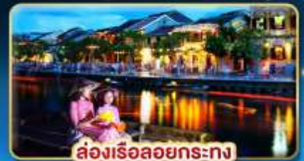
ส่องเรือลอยกระทง