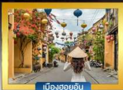
เมืองฮอยอัน