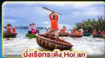
นั่งเรือกระดิง Hoi an