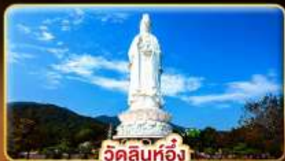
วัดลินห์ฮิ่ง