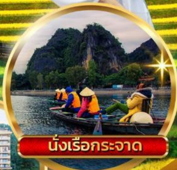
นั่งเรือกระจัด