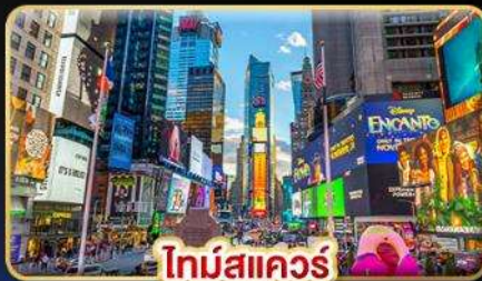
ไทม์สแควร์