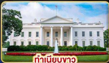
ทำเนียบขาว