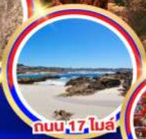
ถนน 17 ไมล์