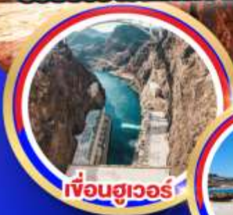
เฟือนฮูเวอร์