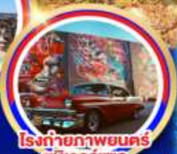
โรงถ่ายภาพยนตร์ ยูนิเวอร์แซล