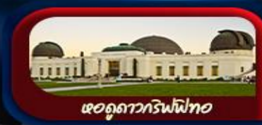
หอดูดาวกริฟฟิท

การันตี 10 ท่านออกเดินทาง พร้อมหัวหน้าทัวร์คนไทย