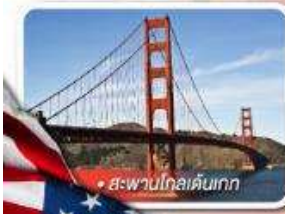
สะพานโกลเด้นเกต