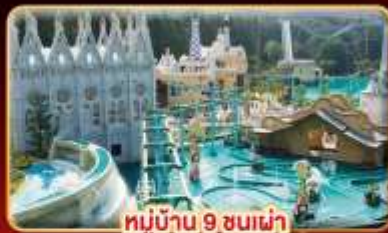
หมู่บ้าน 9 ชนเผ่า