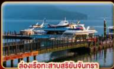
ล่องเรือทะเลสาบสุริยจันทร์

"นั่งรถไฟชมอุทยานอาลีซาน" ปล่อยคอมลอยเส้นทางรถไฟผิงซี