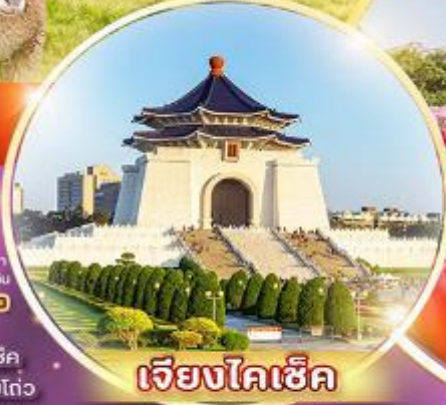
เจียงโคเฮ็ค

ชมสวนดอกไม้เมืองเซ็่อ ฟาร์มแกะ-สิงจิ้ง อู๋สุรณัฐสถานเจียงโคเฮ็ค ส่องเรือทะเลสาบสุริยันจันทรา วัดพระถังซำจั๋ง ป้อมน้ำพุร้อนเป่ย์ถั่ว วัดหลงชาน แวะถ่ายรูปตึกไทเป 101 ซีเหมินติง ไถจงโมถ์มาร์เก็ต พิเศษ..เมฆหมอกนึ่งจักรพรรดิ เมฆเสี้ยวหลงเป่า เมฆซาบูบุฟฟ้าตัสโตลิต์หวัน