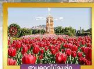
สวนดอกไม้จงเซอ