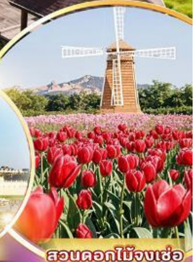
สวนดอกไม้เมืองเซ็่อ