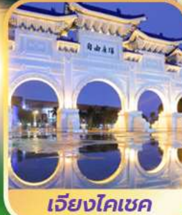
เจียงไคเชค