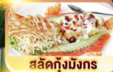
สลัดกุ้งมังกร