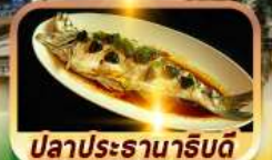
ปลาประจานาริบดี