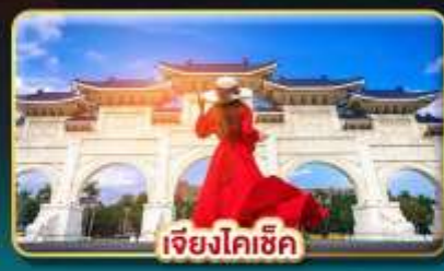
เจียงไคเช็ก