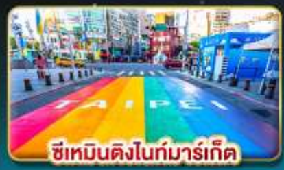
ซีเหมินติงไนท์มาร์เก็ต