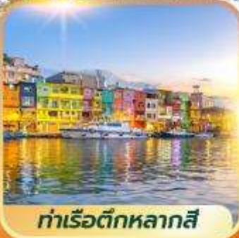
ท่าเรือตึกหลากสี