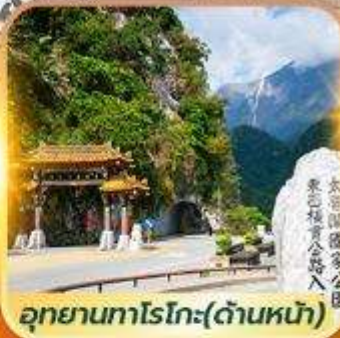
อุทยานทงโรโกะ(ด้านหน้า)