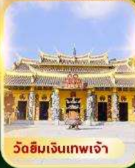
วัดซิมเจินเทพเจ้า