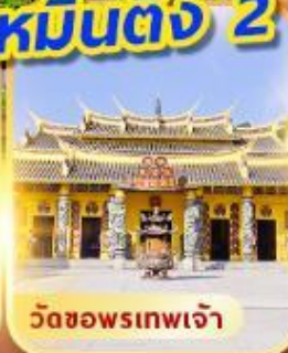
วัดขอพรเทพเจ้า