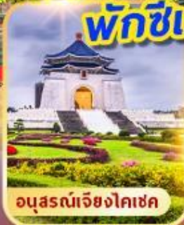
อนุสรณ์เจียงไคเช็ค

เที่ยวเต็ม!! ไม่มีอันอิสระ พักซีเหมินติง 2 คืน