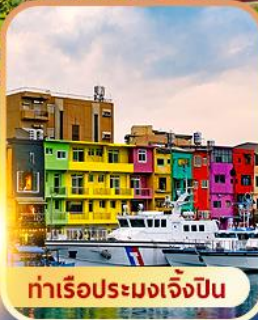
ท่าเรือประมงเจิ้งปิ่น