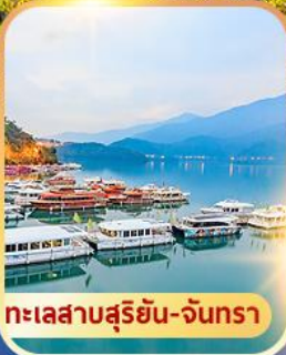
ทะเลสาบสุริยอัน-จันทรา