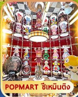
POPMART ซีเหมินติง