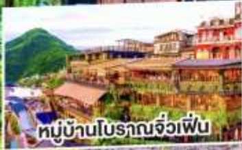
หมู่บ้านโบราณจิวเฟิน