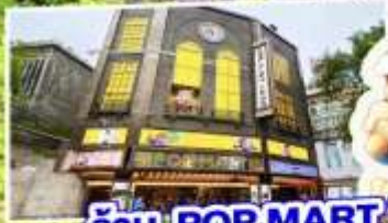
ร้าน POP MART ใหญ่ที่สุดในไต้หวัน