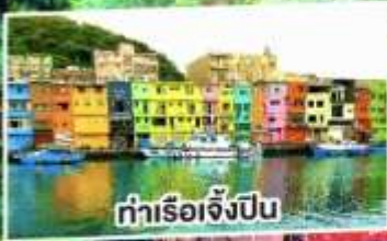
ท่าเรือเจียงปิง