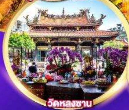
วัดหลงชาน