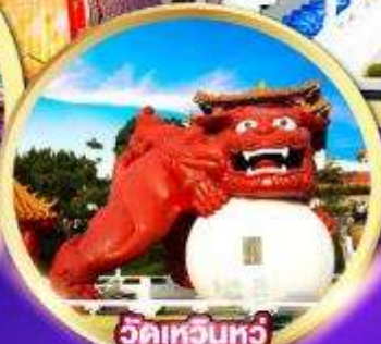
วัดเหวินหู่