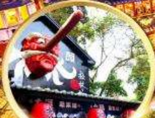
หมู่บ้านปิต่างชไต