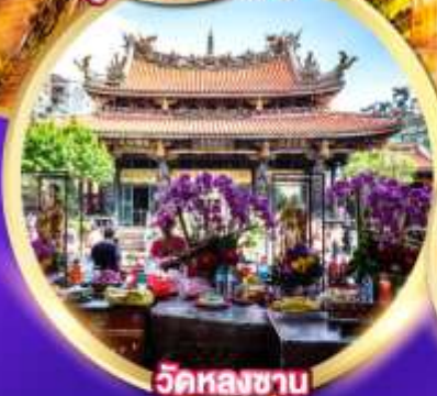
วัดหลงชาน