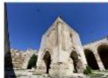
คาราวานสโรน