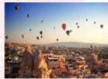
เมืองคัปปาโดเกีย