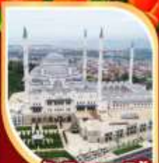
มัสยิดคามลิกา