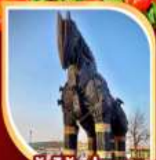
ม้าไม้แห่งทรอย