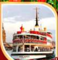
ล่องเรือเฟอร์รี่