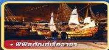
• พิพิธภัณฑ์เรืออาซา