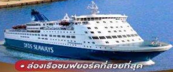
• ล่องเรือชมฟยอร์ดที่สวยงามที่สุด