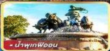
• น้ำพุร้อน Wood