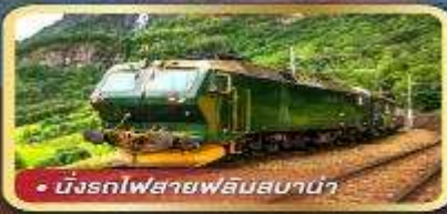
• นักรถไฟสายฟลินสบาน่า