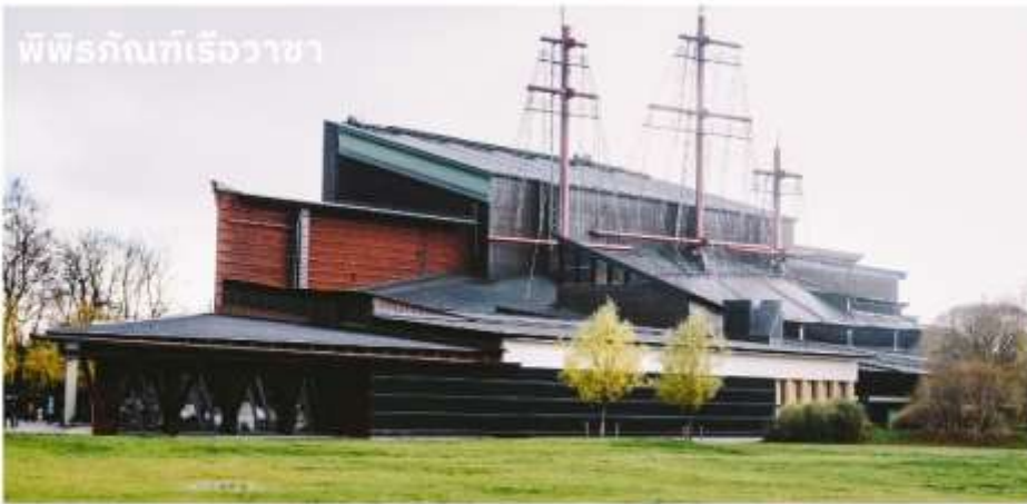
พิพิธภัณฑ์เรือวาซา