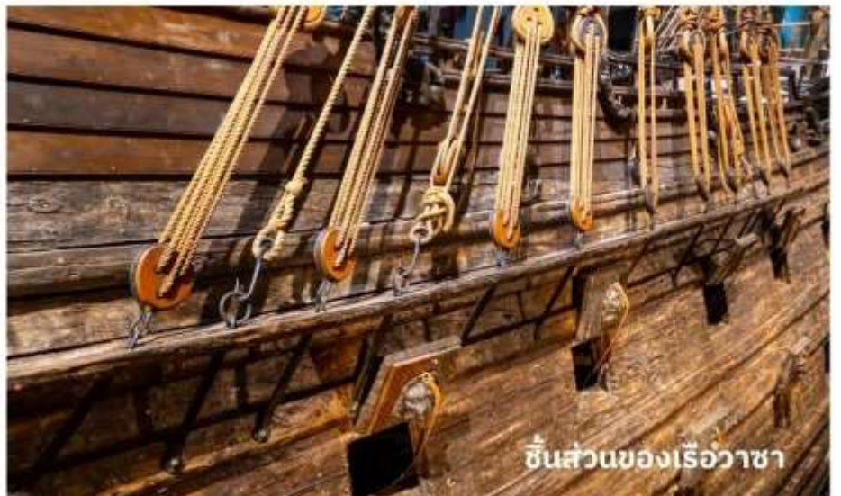
ชิ้นส่วนของเรือวาซา