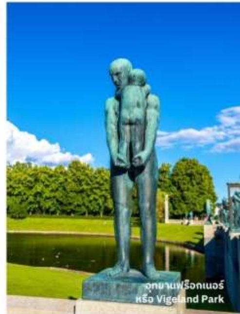
อุทยานฟรีกเนอร์ หรือ Vigeland Park