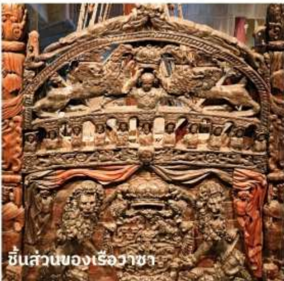
ชิ้นส่วนของเรือวาซา