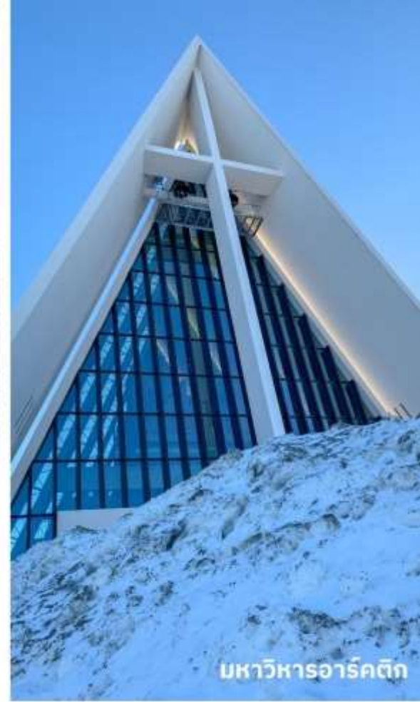
มหาวิหารอาร์คติก

จากนั้นนำท่านถ่ายรูปเป็นที่ระลึกกับอีกหนึ่งโบสถ์ที่สำคัญของเมืองทรอมโซ่