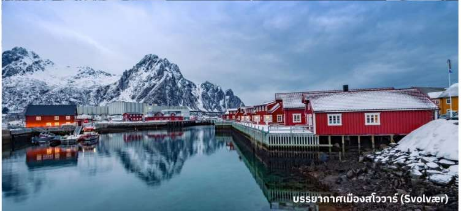
บรรยากาศเมืองสวีวาร์ (Svolvær)