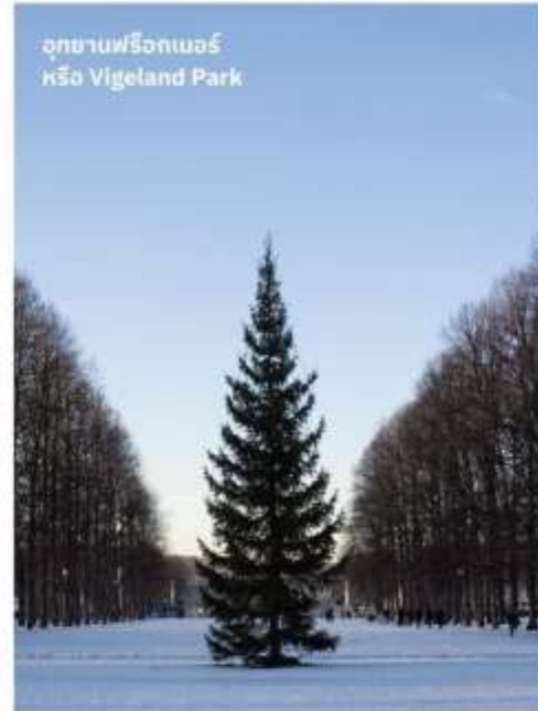
อุทยานฟรีกเนอร์ หรือ Vigeland Park