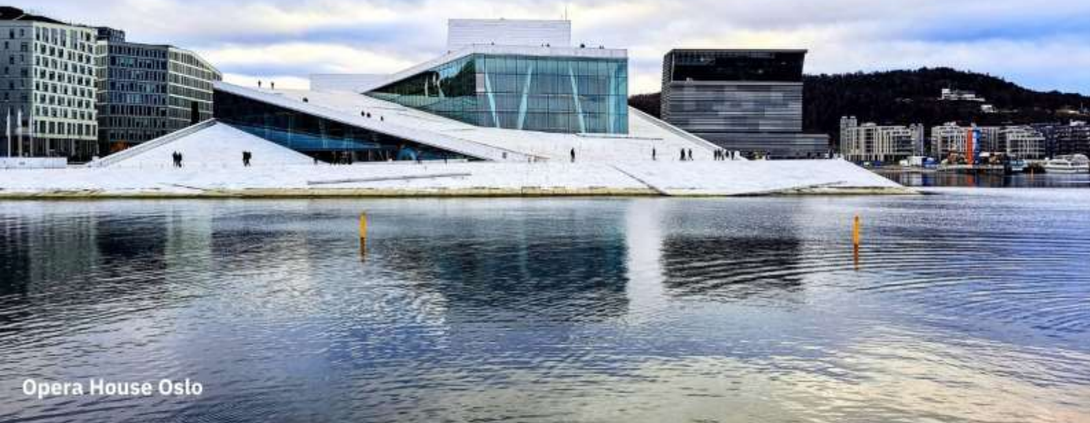
Opera House Oslo

จากนั้นนำท่านถ่ายรูป The Oslo Opera House หนึ่งในโครงการปรับปรุงบริเวณชายฝั่งของออสโล ให้เกิดเป็นพื้นที่ที่มีประโยชน์ ด้วยเงินทุนมหาศาล และการปรับผังการจราจรของชายฝั่งด้านตัวเมือง ออสโล ภายในอาคารมีการจัดแสดงการแสดงโอเปร่าและบัลเลต์ รวมถึงการแสดงศิลปะอื่น ๆ อีกมากมาย มีห้องแสดงหลักที่สามารถรองรับผู้ชมได้มากกว่า 1,300 คน Oslo Opera House เป็นหนึ่งในสถาปัตยกรรมที่โดดเด่นและเป็นที่รู้จักมากที่สุดของประเทศ และได้รับรางวัลหลายรางวัลสำหรับการออกแบบที่สร้างสรรค์และนวัตกรรม