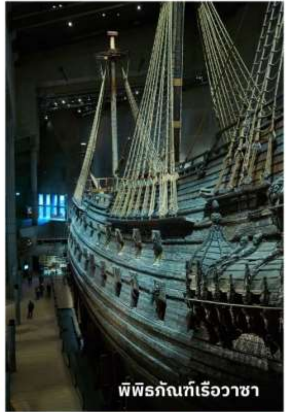
พิพิธภัณฑ์เรือวาซา

เรือลำนี้ได้ถูกยกขึ้นมาจากใต้ทะเลโดยใช้เทคนิคพิเศษที่มีความทันสมัย และได้นำเรือวาซาลำดังกล่าวมาจัดแสดงเป็นพิพิธภัณฑ์ ทุกท่านจะได้พบกับเรือ Vasa ขนาดใหญ่ และจะได้ชมโครงสร้างของเรือ, ประวัติของการสร้างและสถานการณ์ที่ทำให้เรือล่มรวมถึงเรียนรู้เรื่องราวต่างๆ ที่เกี่ยวข้องกับ Vasa ได้อย่างลึกซึ้ง