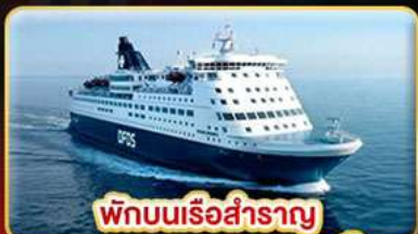
พักผ่อนเรือสำราญ แบบ Window Room 2 คืน