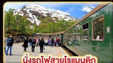
นั่งรถไฟสายโรแมนติก “พร้อมสปา”