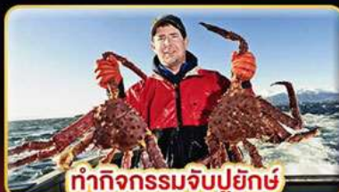
ทำกิจกรรมจับปูยักษ์ “พร้อมเมนูสุดพิเศษ”