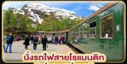
นั่งรถไฟสายโรแมนติก "ฟรอมสมาเนา"