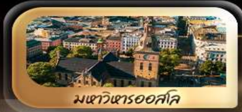
มหาวิหารออสโล