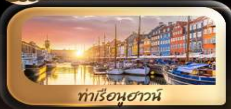
ท่าเรือฮาวาน