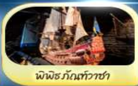
พิพิธภัณฑ์ทิวาชา