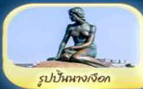
รูปปั้นนางเงือก