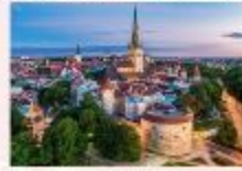
Tallinn Old Town