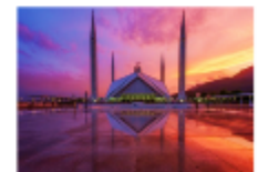
มัสยิดไฟซาล

19.30 น. นำท่านเดินทางสู่สนามบินอิสลามาบัด 23.20 น. ออกเดินทางสู่กรุงเทพฯ เที่ยวบิน TG350