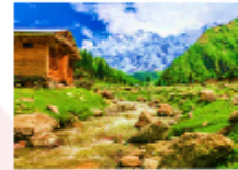
ยอดเขานั่งกาพาร์บัต

** พักที่ Raikot Sarai Hotel หรือเทียบเท่า **