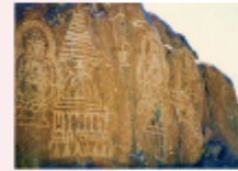
เมืองซีลาส

** พักที่ Shangrila Chilas Hotel หรือเทียบเท่า **