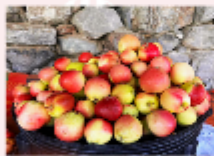
สวนผลไม้ตามฤดูกาล

** พักที่ Duiker Hard Rock Hotel หรือเทียบเท่า **