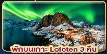
พักผ่อนเกาะ Lofoten 3 คืน