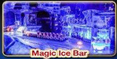
Magic Ice Bar