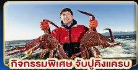
กิจกรรมพิเศษ จับปูคิงแครง