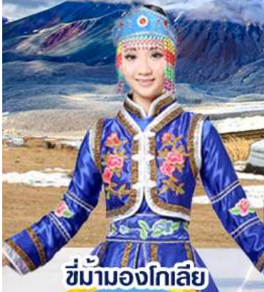
ซึ่ม้ามองโกเลีย