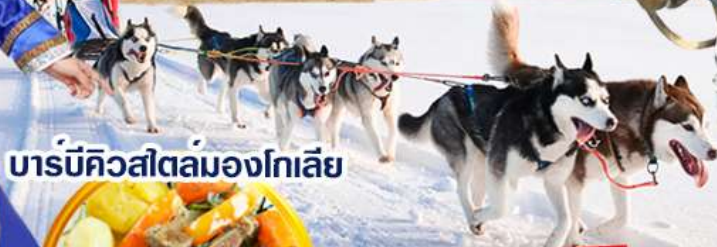
บาร์บีคิวสเตอ์มองโกเลีย