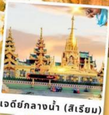
เจดีย์กลางน้ำ (สีเรียม)