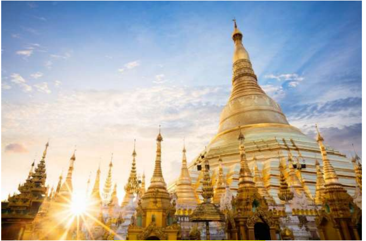
บทธสวตมมตบุชาพระมหาเจดีย์ชเวดากอง

วันทามิ อุตตมะ ชมพู วรรฐาเน สิงกุตตะเร มะโนลัมเม สัตตัง สะรัตนะ ปฐมิง กกุสันธัง สุวรรณะ ตันตัง ธาตุโย ธัสสะติ ทุตติยัง โภนาคะมะนัง ธัมมะ การะนัง ธาตุโย ธัสสะติ ตติยัง กัสสปัง พุทธจีวะรัง ธาตุโย ธัสสะติ จตุกัง โคตะมัง อัตถะเกศา ธาตุโย ธัสสะติ อหัง วันทามิ ตุระโต อหัง วันทามิ ธาตุโย อหัง วันทามิ สัพพะทา อหัง วันทามิ สิระสา