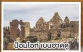
ป้อมโอท์ เบนฮาดดู