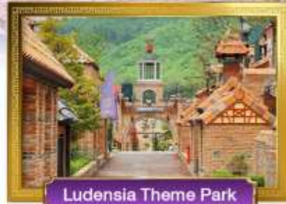
Ludensia Theme Park

• เมนูพิเศษ! บึงย่างเกาหลี, Seafood Hotpot, จิมกัก