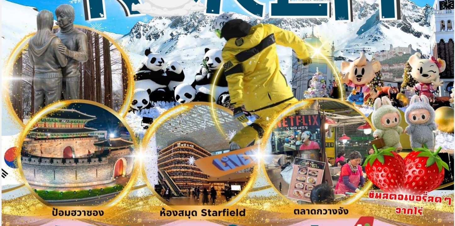
ป้อมฮวาซอง