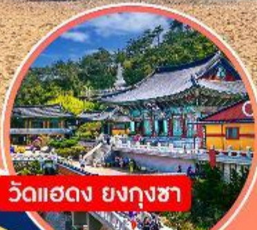
วัดแฮดง ยงกุงซา