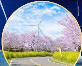
ซากุระ / ทุ่งดอกเรป