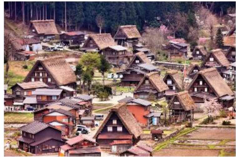
รูปใช้เพื่อประกอบการโฆษณาเท่านั้น