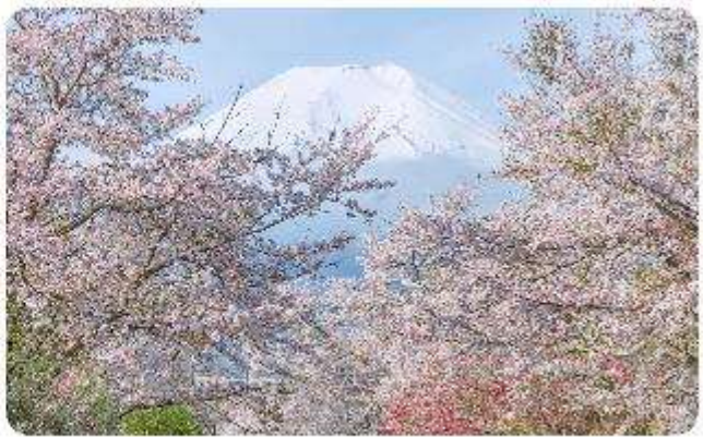
หมู่บ้านน้ำใสโอชิโนะ อักโก

โอชิโนะ อักโก หรือ ที่รู้จักกันในชื่อ หมู่บ้านน้ำใส ความงามแห่งธรรมชาติและวัฒนธรรมที่ ซ่อนอยู่ใต้ภูเขาไฟฟูจิโอชิโนะ อักโก ตั้งอยู่ในหมู่บ้านโอชิโนะ จังหวัดยามานาชิ ประเทศญี่ปุ่น เป็นแหล่งน้ำธรรมชาติที่มีชื่อเสียง ประกอบด้วยบ่อน้ำใสสะอาดทั้งแปดแห่ง ซึ่งน้ำในบ่อเหล่านี้เกิด จากการละลายของหิมะและน้ำแข็งจากภูเขาไฟฟูจิ น้ำที่ไหลลงมานั้นได้ถูกกรองผ่านชั้นหินภูเขาไฟ เป็นเวลาหลายปี จนทำให้น้ำในบ่อมีความบริสุทธิ์และใสจนเห็นถึงก้นบ่อ ไม่เพียงแต่ความงามของ