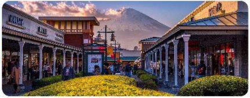
GOTEMBA PREMIUM OUTLETS

จากนั้นพาทุกท่านสู่.. Gotemba Premium Outlets ห้างเอาท์เลตที่มีขนาดใหญ่ที่สุดในญี่ปุ่น ตั้งอยู่ที่ ฮาโกเน่ จังหวัดคานากาวา ของประเทศญี่ปุ่น เป็นแหล่งช้อปปิ้งที่มีทั้ง แบรินด์ในประเทศและแบรินด์ ต่างประเทศ ถ้าอยากหาของอะไรให้มาที่นี่ได้เลย อีกทั้งในบริเวณนี้ ยังเป็นทางผ่านไปเที่ยว ภูเขาไฟฟูจิ และ ทะเลสาบฮาโกเน่ อีกด้วย และยังสามารถมองเห็นภูเขาไฟฟูจิได้จากตรงนี้แบบชัด ๆ ไปเลย คือเดินช้อปปิ้งเราก็ จะเห็นจุดพิกัดเอาไว้ชมวิวฟูจิสวย ๆ ไปด้วย เป็นอีกสถานที่ที่อยากให้สายเที่ยว สายช้อปปิ้งได้มาชมวิวและละลาย ทรัพย์กันอย่างมากมายจริง ๆ