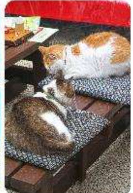
เกาะเอโนะชิมะ

เมืองคามาคุระ (Kamakura) เมืองน่ารักติดทะเล ตบโจทย์ที่เที่ยวที่ผสมผสานระหว่างประวัติศาสตร์ ธรรมชาติ และความงามของทะเล บอกเลยใครมาต้องตกหลุมรักกับเมืองสุดชิล อย่าง คามาคุระ เมืองเล็กๆ ที่ตั้งอยู่ทางตอนใต้ของจังหวัดคานากาวะ ห่างจากโตเกียวเพียงแค 1 ชั่วโมง เท่านั้น แต่เต็มไปด้วยสถานที่ท่องเที่ยว ทิวทัศน์ธรรมชาติ และชายหาดที่งดงาม ที่นี้จะทำให้ทุกคนรู้สึกเหมือนได้ย้อนกลับไปสัมผัสประวัติศาสตร์ญี่ปุ่นในยุคซามูไร พร้อมทั้งได้ผ่อนคลายท่ามกลางบรรยากาศที่เงียบสงบและสดชื่น