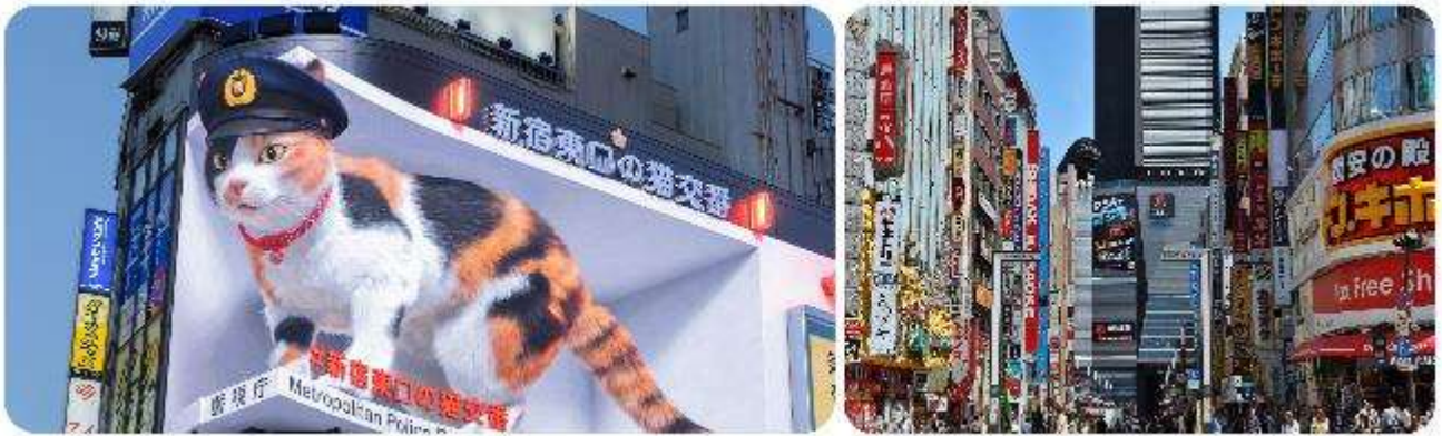
ช้อปปิ้งใจกลางกรุงโตเกียว - ซินจูกุ

มือกลางวัน บริการท่านด้วย ชุดอาหารญี่ปุ่นเบนโตะ