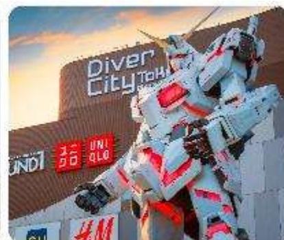
ย่านโอไดบะ ห้างไดเวอร์ซิตี ODAIBA SEASIDE PARK