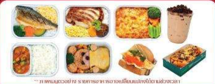
** ภาพเมนูตัวอย่าง รายการอาหารอาจเปลี่ยนแปลงได้ตามช่วงเวลา