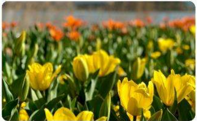
สวนโออิชิ ปาร์ค

สวนดอกไม้โออิชิ พาร์ค (Oishi Park) มหัศจรรย์แห่งวิวกุเขาไฟฟูจิ หนึ่งในจุดชมวิวของ ภูเขาไฟฟูจิที่สวยงามที่สุดอีกจุดหนึ่ง ที่จะเติมเต็มความสงบและความงดงามของธรรมชาติในญี่ปุ่นเมื่อ ไปเยือน คือสถานที่ที่ไม่ควรพลาด สวนดอกไม้โออิชิ พาร์ค (Oishi Park) แห่งนี้ไม่ได้เป็นเพียง สถานที่ที่มีดอกไม้สวยงามให้เราได้ชื่นชมแล้ว จุดเด่นของสวนนี้คือวิวกุเขาฟูจิที่อยู่เบื้องหลังสวน ดอกไม้สีสันสดใส ที่บานสะพรั่งในทุกฤดูกาล และยังเป็นมุมที่เราได้สัมผัสกับวิวกุเขาฟูจิได้อย่าง ใกล้ชิด จากนั้นนำพาทุกท่านสู่..