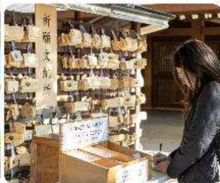
ศาลเจ้าเมจิจิงกู

ศาลเจ้าเมจิ หนึ่งในสถานที่อันศักดิ์สิทธิ์ใจกลางกรุงโตเกียว สิ่งแรกที่จะทำให้คุณประทับใจคือการเดินผ่านเสาโทริอิขนาดใหญ่ ระหว่างทางมีธรรมชาติที่ทำให้รู้สึกเหมือนก้าวเข้าสู่อีกโลกหนึ่ง ที่เต็มไปด้วยความสงบ อีกทั้งยังสามารถเขียนคำอธิษฐานลงบนแผ่นไม้ "เอมะ" เพื่อขอพรสำหรับความสุขและความสำเร็จในชีวิตอีกด้วย จากนั้นนำพาทุกท่าน... ซุปปังกันต่อใจกลางกรุงโตเกียว เมืองที่เป็นศูนย์กลางของแฟชั่นและนวัตกรรม และเปิดประสบการณ์การซูปปังที่ไม่เหมือนใคร! สักรวดย่านต่าง ๆ ที่แต่ละแห่งที่มีเสน่ห์และเอกลักษณ์อันโดดเด่น เมืองที่เต็มไปด้วยชีวิตชีวาและความทันสมัยที่หลากหลายอย่าง ย่านฮาราจุกุ แหล่งรวมแฟชั่นที่แปลกใหม่และสดใส เดินเล่นบน Takeshita Street ที่เต็มไปด้วยเสื้อผ้าและเครื่องประดับที่ไม่ซ้ำใคร เพลิดเพลินกับบรรยากาศสุดคูลที่เป็นเอกลักษณ์