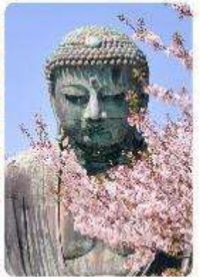
พระใหญ่ไดบุทสึ วัดโคโตคุอิน

จุดเด่นแห่งเมืองนี้คือ พระพุทธรูปองค์ใหญ่ไดบุทสึ (Daibutsu) หนึ่งในสัญลักษณ์ที่โดดเด่นที่สุดของ Kamakura พระพุทธรูปบронซ์ขนาดมหึมาที่วัดโคโตคุอิน (Kotoku-in) ที่มีความสูง 13.35 เมตร หนึ่งในพระพุทธรูปที่ใหญ่ที่สุดในญี่ปุ่น ไฮไลท์ของที่นี่คือการได้ชมความงามที่ตัดกันระหว่างพระพุทธรูปไดบุทสึขนาดใหญ่และต้นซากุระ ซึ่งปลูกอยู่ทั้งด้านหน้าและด้านหลังของพระพุทธรูป ทำให้เหมาะอย่างยิ่งกับการเดินเล่นและชมซากุระในบริเวณวัด เป็นอีกหนึ่งสถานที่ที่ต้องมาเยือนสักครั้ง หนึ่งในจุดไฮไลท์ของเมืองคามาคุระคือ ไมโกไลกันพาเยียน เกาะเอโนะชิมะ (Enoshima) เป็นเกาะที่ตั้งอยู่ในจังหวัดคานากาวะ ประเทศญี่ปุ่น ซึ่งเป็นจุดหมายท่องเที่ยวยอดนิยมที่มีทิวทัศน์สวยงามและสถานที่ที่น่าสนใจมากมาย ทั้งชายหาดสวย และวิวทะเลที่งดงาม ในวันที่ท้องฟ้าโปร่งใสเรายังสามารถมองเห็นวิวของภูเขาไฟฟูจิได้อีกด้วย ด้านบนยังมี ศาลเจ้าเอโนชิมะ ที่มีความสำคัญในด้านความโชคดี โดยเฉพาะในเรื่องความรัก นอกจากนี้ยังมี หอคอยประภาคารเอโนชิมะ ที่ให้ทัศนียภาพ 360 องศา ของเมืองคามาคุระได้อีกด้วย