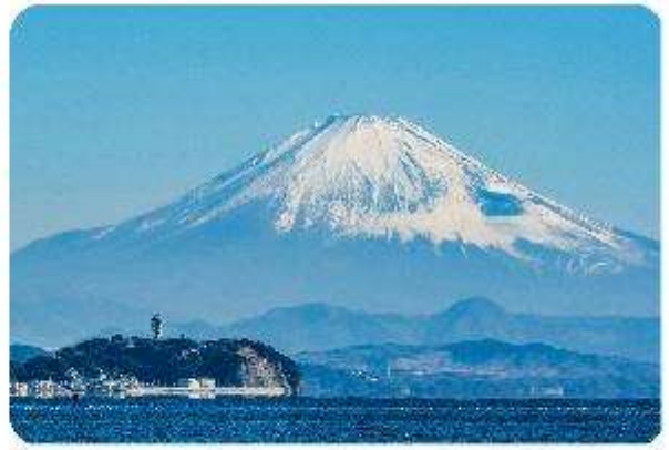
เกาะเอโนะชิมะ

เมืองคามาคุระ (Kamakura) เมืองน่ารักติดทะเล ตอบโจทย์ที่เที่ยวที่ผสมผสานระหว่างประวัติศาสตร์ ธรรมชาติ และความงามของทะเล บอกเลยใครมาต้องตกหลุมรักกับเมืองสุดชิล อย่าง คามาคุระ เมืองเล็กๆ ที่ตั้งอยู่ทางตอนใต้ของจังหวัดคานากาวะ ห่างจากโตเกียวเพียงแค่ 1 ชั่วโมง เท่านั้น แต่เต็มไปด้วยสถานที่ท่องเที่ยว ทิวทัศน์ธรรมชาติ และชายหาดที่งดงาม ที่นี้จะทำให้ทุกคนรู้สึกเหมือนได้ย้อนกลับไปสัมผัสประวัติศาสตร์ญี่ปุ่นในยุคซามูไร พร้อมทั้งได้ผ่อนคลายท่ามกลางบรรยากาศที่เงียบสงบและสดชื่น