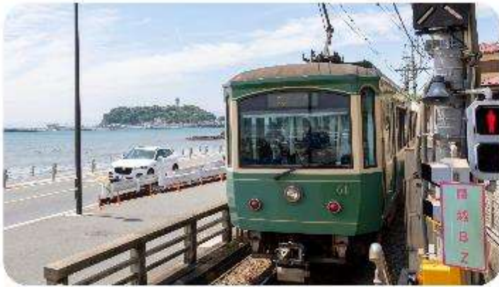
เมืองคามาคุระ