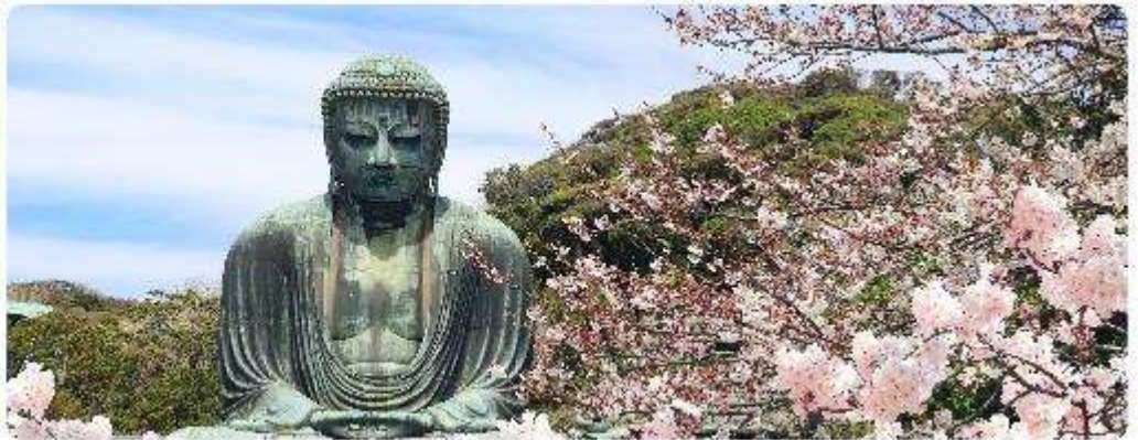
พระใหญ่ไดบุทสึ วัดโคโตคุอิน

จุดเด่นแห่งเมืองนี้คือ พระพุทธรูปองค์ใหญ่ไดบุทสึ (Daibutsu) หนึ่งในสัญลักษณ์ที่โดดเด่นที่สุดของ Kamakura พระพุทธรูปบรอนซ์ขนาดมหึมาที่วัดโคโตคุอิน (Kotoku-in) ที่มีความสูง 13.35 เมตร หนึ่งในพระพุทธรูปที่ใหญ่ที่สุดในญี่ปุ่น ไฮไลท์ของที่นี่คือการได้ชมความงดงามที่ตัดกันระหว่างพระพุทธรูปไดบุทสึขนาดใหญ่และต้นซากุระ ซึ่งปลูกอยู่ทั้งด้านหน้าและด้านหลังของพระพุทธรูป ทำให้เหมาะอย่างยิ่งกับการเดินเล่นและชมซากุระในบริเวณวัด เป็นอีกหนึ่งสถานที่ที่ต้องมาเยือนสักครั้ง หนึ่งในจุดไฮไลท์ของเมืองคามาคุระคือ ไม่ไกลกันพาเยือน เกาะเอโนชิมะ (Enoshima) เป็นเกาะที่ตั้งอยู่ในจังหวัดคานากาวะ ประเทศญี่ปุ่น ซึ่งเป็นจุดหมายท่องเที่ยวยอดนิยมที่มีทิวทัศน์สวยงามและสถานที่ที่น่าสนใจมากมาย ทั้งชายหาดสวย และวิวทะเลที่งดงาม ในวันที่ท้องฟ้าโปร่งใสเรายังสามารถมองเห็นวิวของภูเขาไฟฟูจิได้อีกด้วย ด้านบนยังมี ศาลเจ้าเอโนชิมะ ที่มีความสำคัญในด้านความโชคดี โดยเฉพาะในเรื่องความรัก นอกจากนี้ยังมี หอคอยประภาคารเอโนชิมะ ที่ให้ทัศนียภาพ 360 องศา ของเมืองคามาคุระได้อีกด้วย