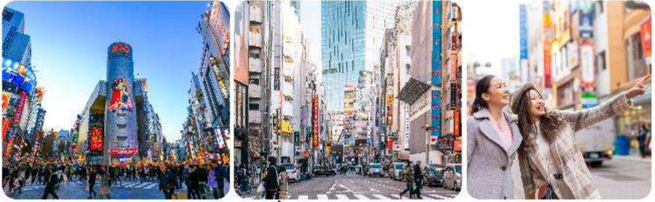
ช้อปปิ้งใจกลางกรุงโตเกียว