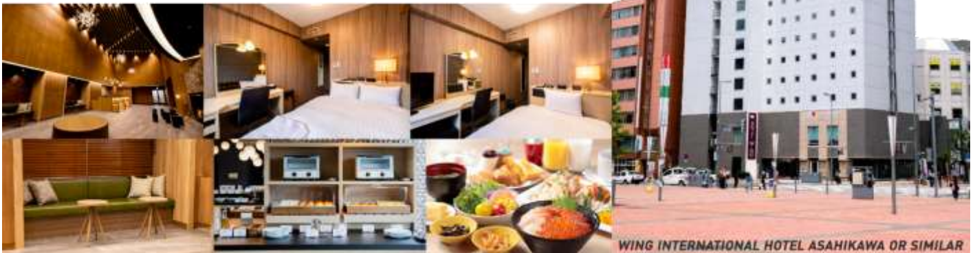
WING INTERNATIONAL HOTEL ASAHIKAWA OR SIMILAR

ที่พัก WING INTERNATIONAL HOTEL หรือ ART ASAHIKAWA, หรือเทียบเท่า